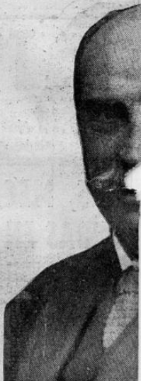
Ex - Presidente

NOVEDADES ha venido informando ampliamente, no obstante la reserva que del asunto se guarda, acerca de las actividades informaciones, que como se verá son de gran interés. Se dan datos políticos, que se vienen realizando en favor de una candidatura presidencial del señor ex-presidente de la república, objeto de los más variados comentarios pues se considera la importancia que tienen esas actividades para el problema político